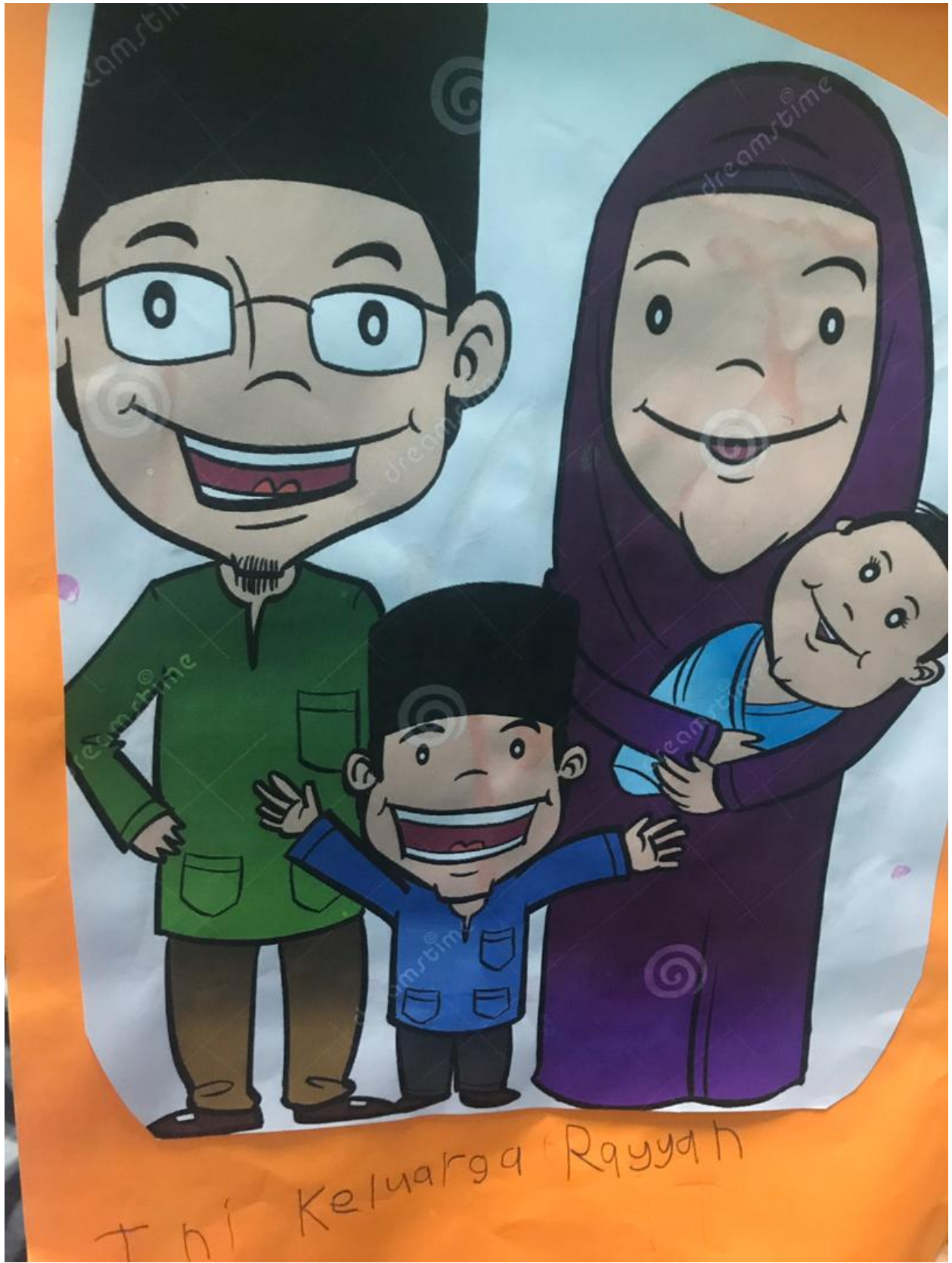
Tini Keluarga Rayyah